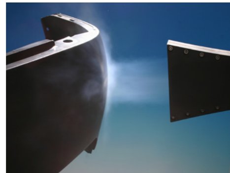
Čištění plastových nárazníků před lakováním aplikací Cryosnow

Efekt oxidu uhličitého se projevuje v pěnových plastech nejen snížením spotřeby surovin, ale i dobrými vlastnostmi pěnových výrobků jako je nízká hustota, výborná akustická i tepelná izolace, mechanické tlumení, nízká propustnost pro vodní páru a snížená absorpce vlhkosti. Odlišnými postupy je umožněno vyrábět různé typy pěny, které se používají v mnoha oblastech, včetně balení, tepelné nebo zvukové izolace nebo čalounění.