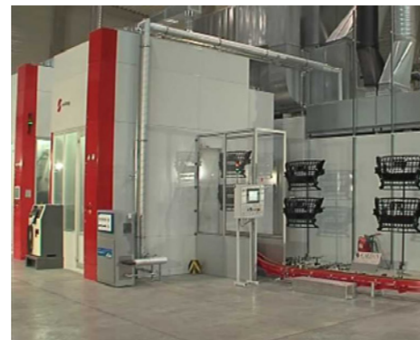
Zařízení Cryosnow s přívodem kapalného oxidu uhličitého (izolované potrubí)

Pokud se nevyžaduje agresivní způsob čištění, lze použít aplikaci oxidu uhličitého zvanou CRYOSNOW – čištění sněhem . Suchý led/sněh se v tomto případě