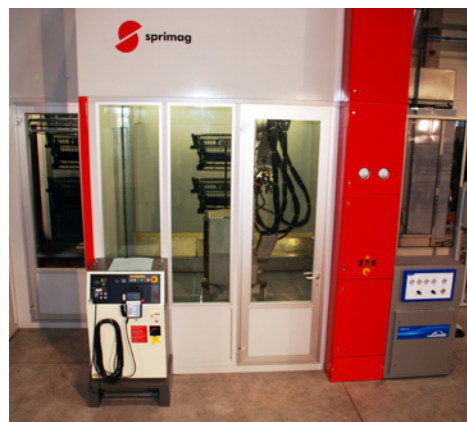
Tryskácká kabina (Cryosnow) zakomponovaná do automatické lakovací linky

Ve zpracování plastů nachází oxid uhličitý použití nejen jako ekologicky příznivý prostředek pro vypěňování plastů, ale i pro čištění plastů před lakováním, a to jako náhrada chemicky škodlivých látek organických rozpouštědel, které se dnes běžně používají.