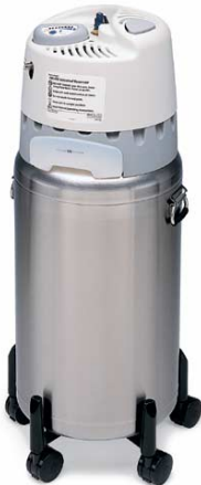
Helios 20 (průtok do 15 litrů/min)

Zdrojové: slouží k inhalacím doma napřímou a jako zdroj pro plnění přenosných zásobníků