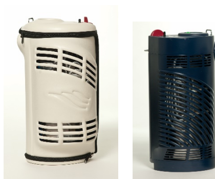
Companion C1000 (průtok do 6 litrů/min), Companion C1000T (průtok do 15 litrů/min), STROLLER (průtok do 6 litrů/min), STROLLER PED (průtok od 0,05 – 2 Litry/min), HiFlow STROLLER (průtok do 15 litrů/min)