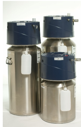
Universal U46 (průtok do 10 litrů/min) Liberator 45 a Liberator Liberator 45 PED (průtok 0,05 – 2 litry/min)

Přenosné: po zaškolení technikem si pacient plní přenosný zásobník sám nebo jeho blízká osoba doma, ideálně půl hodiny před plánovaným odchodem z domu.